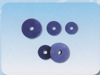
Guarnizioni per sede rubinetto Gaskets seal for valve